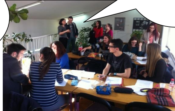
Activités supplémentaires dans la bibliothèque.