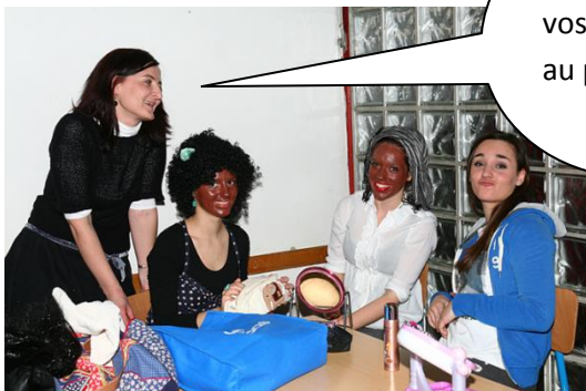
Nous préparons des pièces de théâtre en français