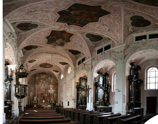
Pendant nos cours d'arts plastiques nous découvrons l'architecture des monuments culturels de Zagreb !

On se prépare pour le concours régional de français !