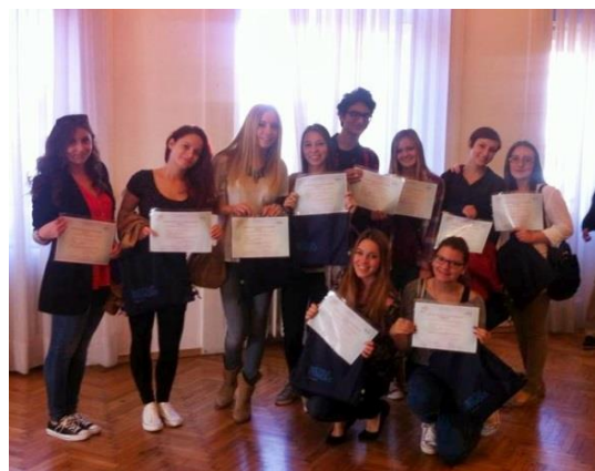
La remise des diplômes du DELF bien mérités : c'est un moment de fête.

Et ce qu'il y a de mieux – les générations bilingues précédentes viennent nous rendre visite pour se souvenir comment c'était magnifique d'être en section bilingue et aussi pour nous encourager dans nos projets actuels .