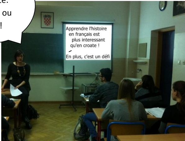
Notre cours d'histoire en français

Marie-Antoinette: coupable ou victime ?!